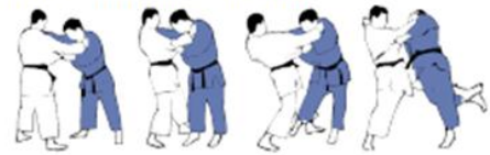
O-UCHI-GARI (3) Grand fauchage intérieur