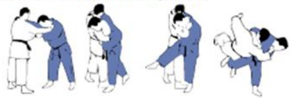
O-SOTO-GARI (3) Grand fauchage extérieur