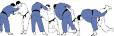
UCHI-MATA(3) Fauchage par l'intérieure de la cuisse