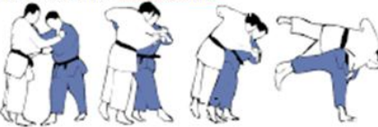
HARAI-GOSHI(3) Hanche balayée