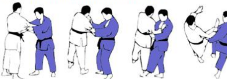
KO-SOTO-GARI(2) Petit fauchage extérieur