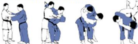
KOSHI-GURUMA(3) Roue autour des hanches