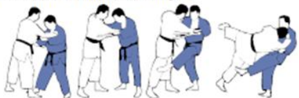
HIZA-GURUMA(3) Roue autour du genou