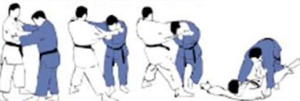
KO-UCHI-GAR(3) Petit fauchage intérieur