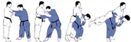
SEOI-NAGE(3) (moroté, ippon, éri) Projection par l'épaule